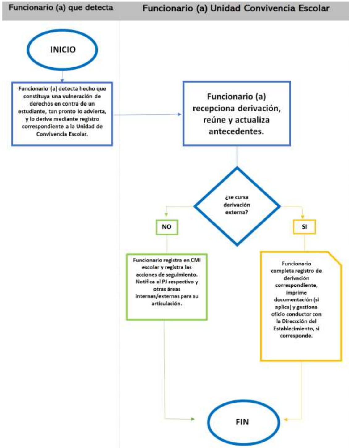
Diagrama de flujo para poner en conocimiento hechos constituyentes de vulneración de derechos del estudiante del Liceo Josefina